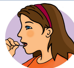
Passer sous la langue