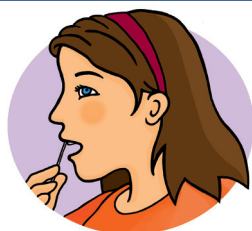
Espace gingival supérieur (sous la lèvre)

Frottis buccal (échantillon salivaire) : effectuer le prélèvement, à l'aide de l'écouvillon le plus gros et en le tournant légèrement, au niveau de :