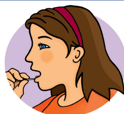
Espace gingival inférieur (sous la lèvre)