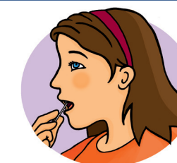
Finir par le palais dur et mou