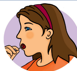
Joue interne des deux cotés